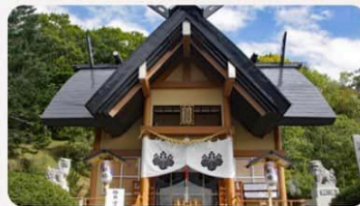
◆浦幌神社◆ 北海道十勝郡浦幌町字東山町18番地の1 TEL: 015-576-2448